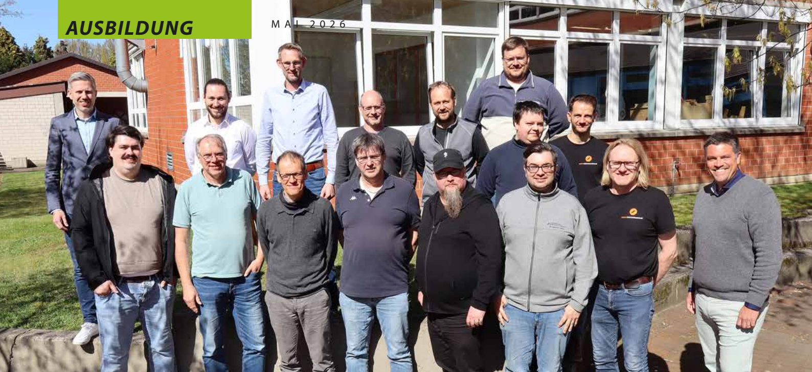
Dieses Jahr fand der Erfahrungsaustausch für Ausbilder der Überbetrieblichen Ausbildung fürs Elektro-Handwerk im HBZ Minden statt.