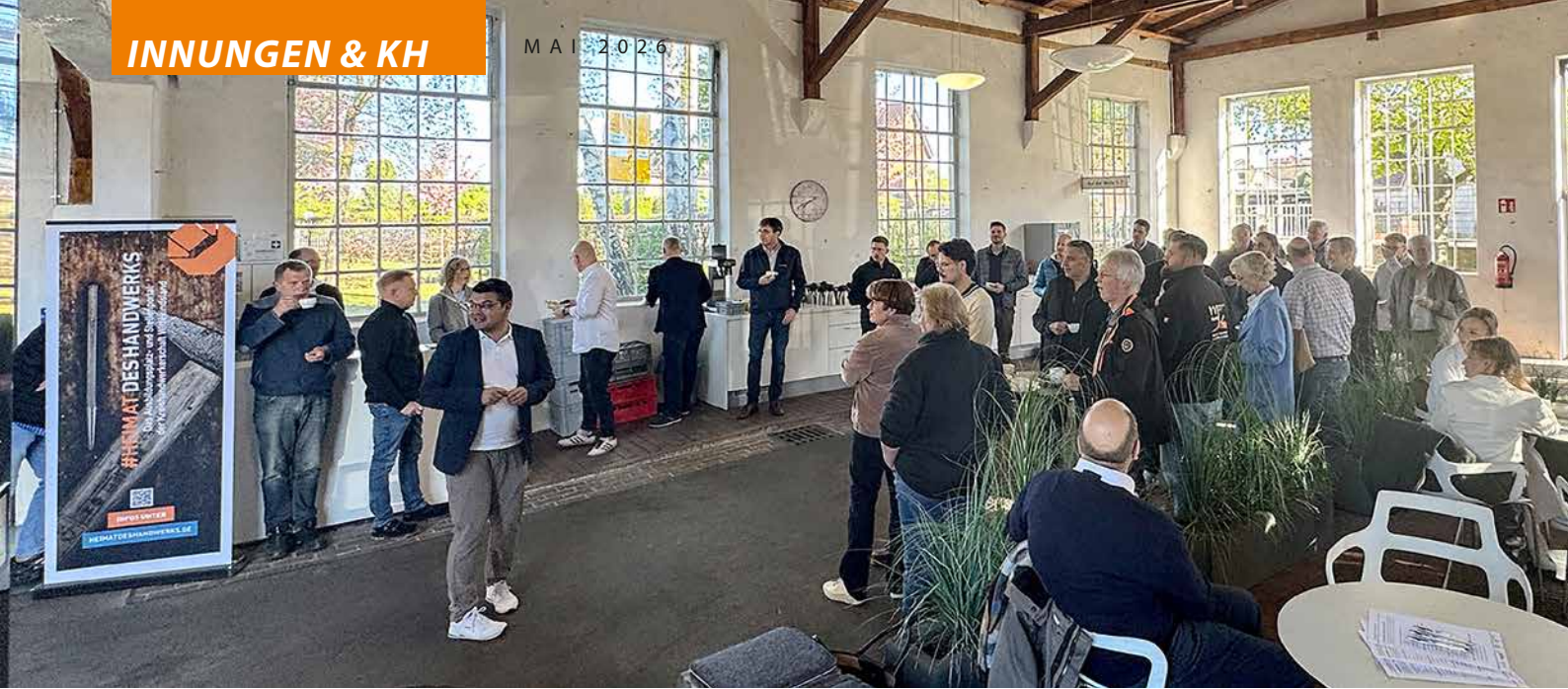
Passendes Ambiente für das dritte interkommunale Handwerkerfrühstück: Der Loksuppen der Firma Heinrich Meier Eisengießerei in Rahden.