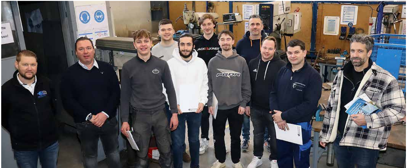
Die Mitglieder des Prüfungsausschusses der Fachinnung Metall Herford konnten allen sechs Metallbauern zur bestandenen Gesellenprüfung gratulieren und ihnen die entsprechenden Bescheinigungen überreichen.