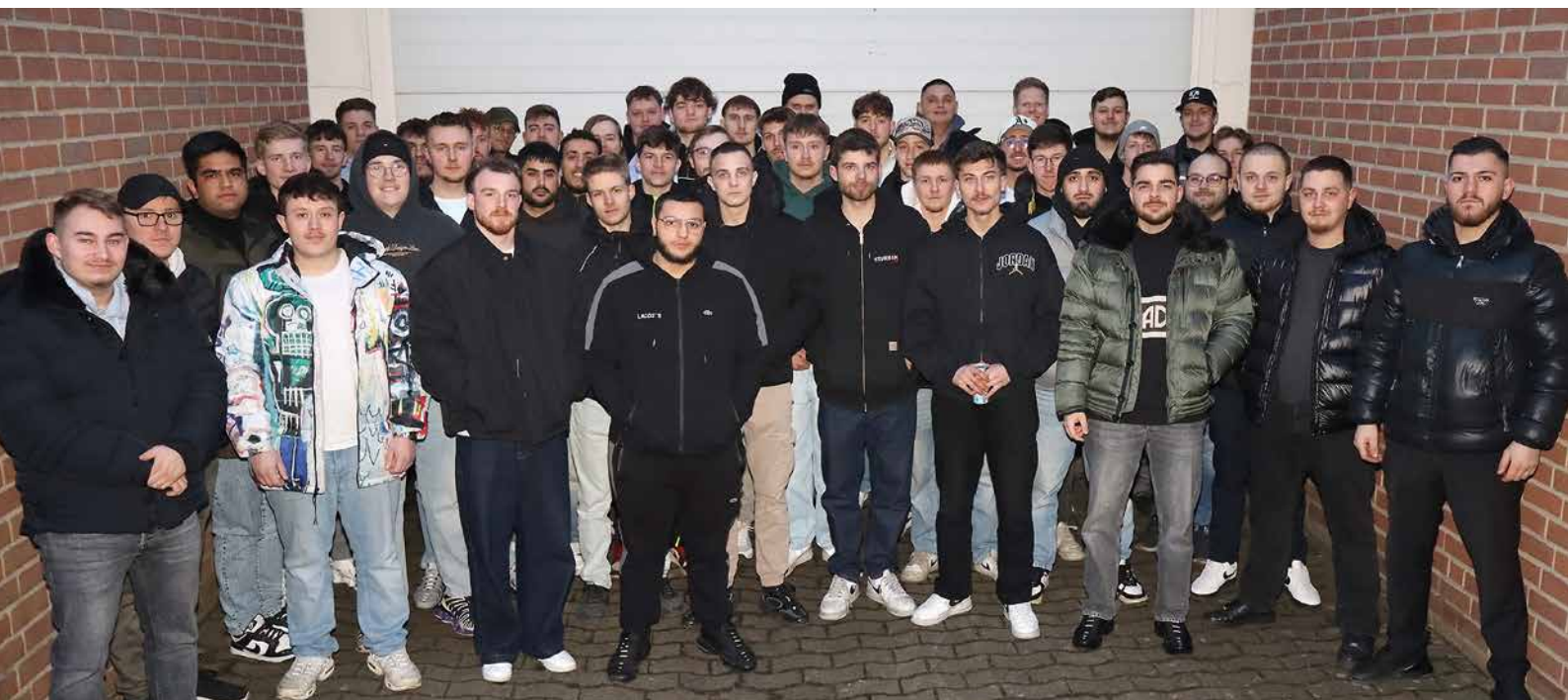
Diese neuen Kfz-Mechatroniker haben ihre Gesellenprüfungen im Bildungszentrum Metall in Kirchlengern bestanden und erhielten die entsprechenden Bescheinigungen.