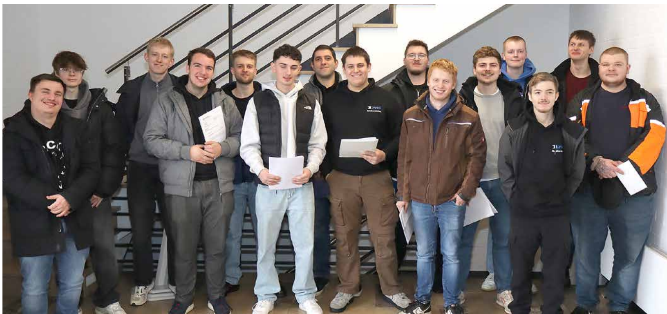
Ihre Prüfungen zum Metallbauer im HBZ Lübbecke erfolgreich abgeschlossen haben diese vormaligen Azubis.