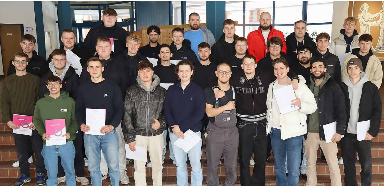
Diese Absolventen erhielten im HBZ Minden ihre Prüfungsbescheinigungen, die ihre Qualifikationen als Kfz-Mechatroniker für Nutzfahrzeuge, für Pkw oder für System- und Hochvolttechnik belegen.