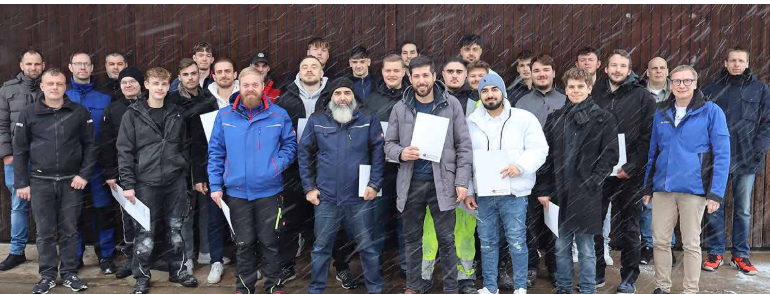
Insgesamt 26 vormaligen Azubis konnten die Mitglieder des Prüfungsausschusses zur bestandenen Gesellenprüfung gratulieren.