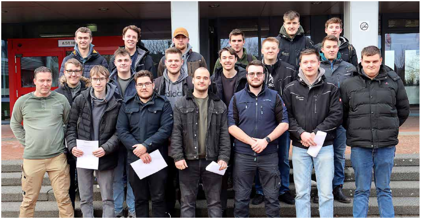
Ihre Gesellenprüfungen zum Land- und Baumaschinenmechatroniker geschafft haben 18 vormalige Azubis.