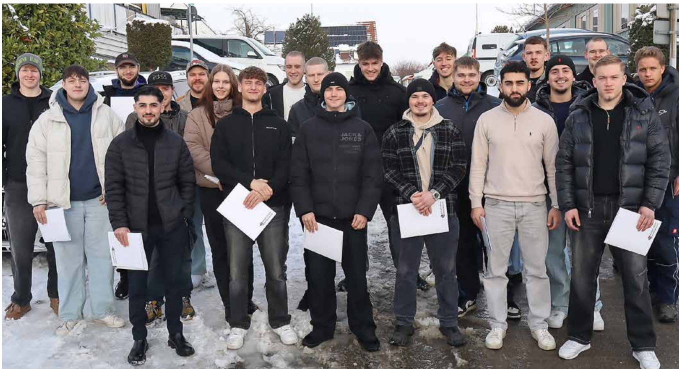
Wie im Vorjahr haben erneut 20 Azubis erfolgreich ihre Gesellenprüfungen abgelegt und verstärken dadurch personell das SHK-Handwerks im Kreis Herford. Dieses Mal gehört aber auch eine SHK-Anlagenmechanikerin dazu.