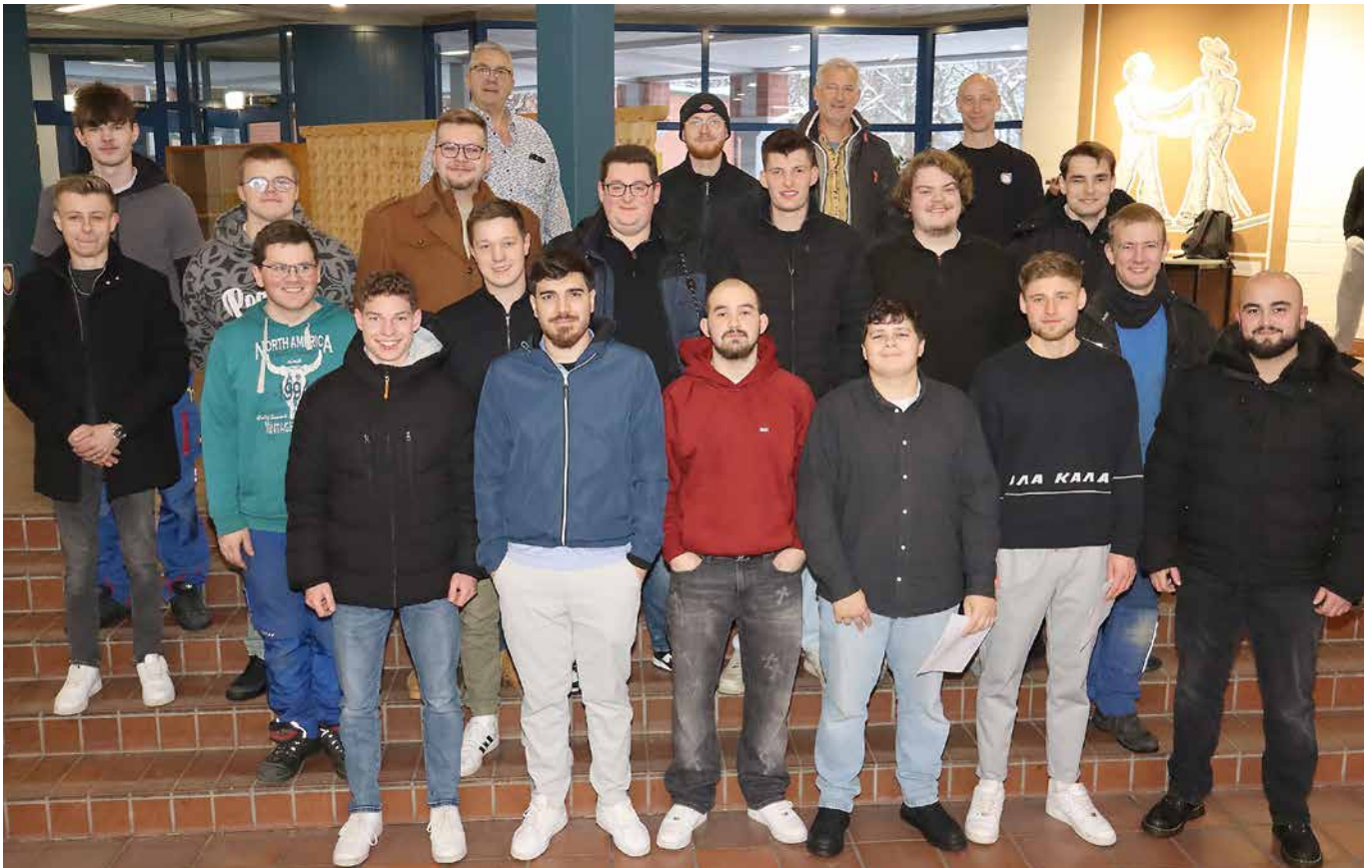
Ausbildern und Prüfer gratulierten den neuen Fachkräften im Minden-Lübbecker SHK-Handwerk.