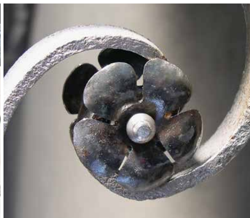
Der Zahn der Zeit hatte kräftig an den Rosetten an einem alten Geländer (linkes Bild) genagt. Im Zuge der Restaurierung wurden die Rosetten von Bernd Schnelle neu geschmiedet – was nicht nur handwerkliche Geschick, sondern auch Wissen über früher übliche Gestaltungsweisen erfordert.