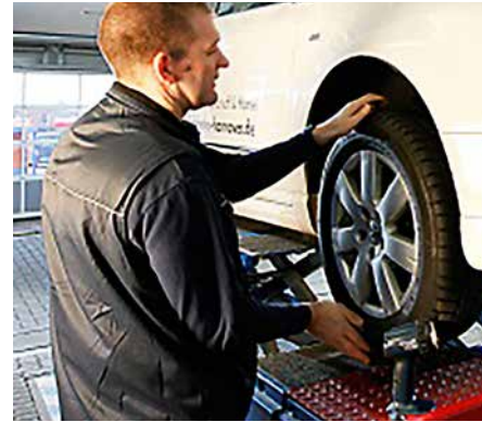
Achsaufhängungen zählen zu häufigen Schwachstellen an Nutzfahrzeugen.

Besonders häufig stellen die Sachverständigen Defekte an der Beleuchtung fest. Defekte an der hinteren Beleuchtung fanden Sachverständige beispielsweise bei 2,7 Prozent der einjährigen Nutzfahrzeuge, bei 7,1 Prozent der Fünfjährigen und bei 12,2 Prozent der Zehnjährigen. Eine funktionierende Beleuchtung ist für die Sicherheit im Straßenverkehr aber unerlässlich. Eine regelmäßige Kontrolle der Beleuchtung durch Halter und Fahrer könnte die Zahl dieser Mängel deutlich reduzieren.