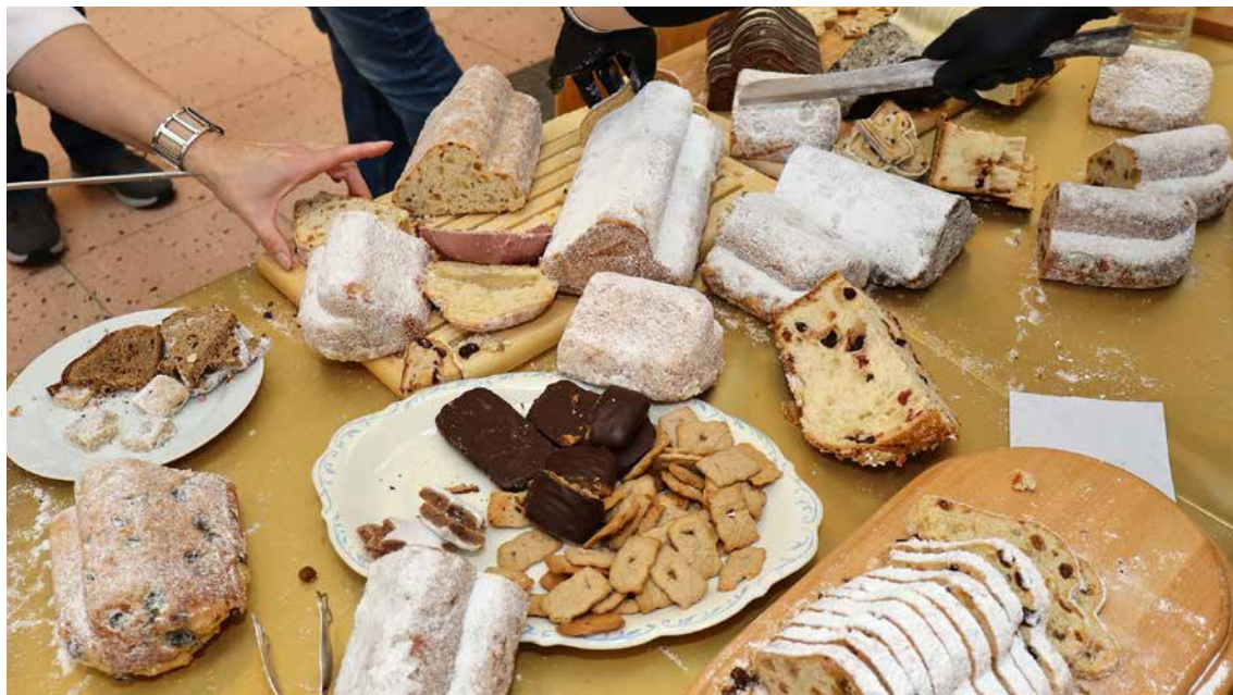
Christstollen sind in nahezu jeder heimischen Handwerksbäckerei zu finden. Und selbst wenn sie sich optisch ähneln, werden sie unterschiedlich schmecken – da in jeder Backstube mit individuellen Rezepturen gearbeitet wird.