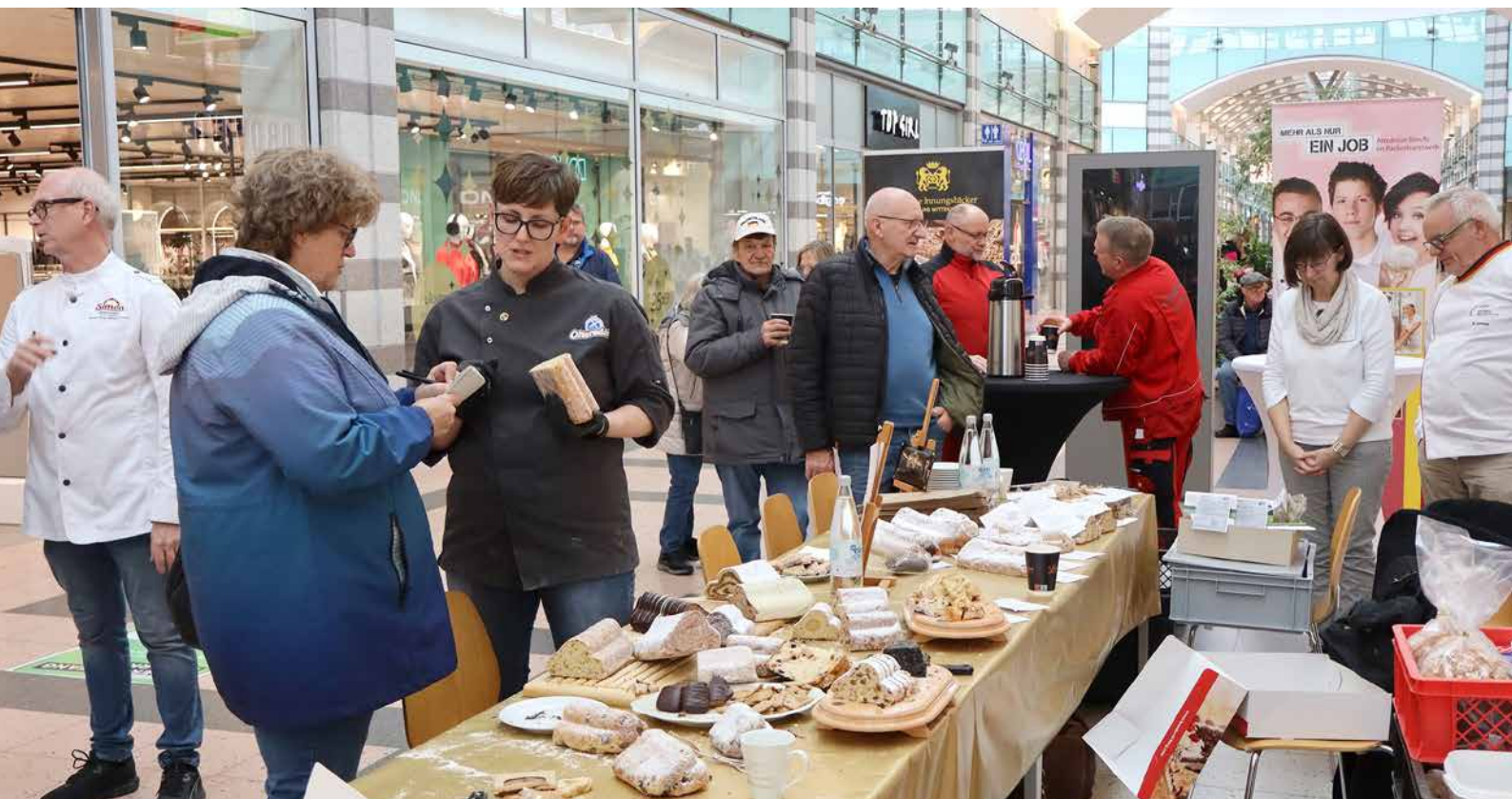
Die öffentliche Qualitätsprüfung fürs Weihnachtsgebäck im Werre-Park mit zugehöriger Verkostung wurde dieses Mal von den Passanten reger genutzt als in den Vorjahren und wurde dadurch auch eine geschmackvolle Werbung fürs heimische Bäcker-Handwerk.

tus eine Gold-Prämierung ein. Ebenfalls mehrere „sehr gut“-bewertete Stollen kamen von der Feinbäckerei Brante (Bad Oeynhausen), der Seeger Brot GmbH (Bad Oeynhausen), der Bäckerei Schuster (Kirchlen- gern) und der Bäckerei Vollmer (Bünde).