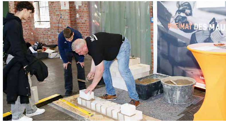
Jugendliche für eine Ausbildung zum Maurer zu interessieren, ist nur der Anfang. Sie bis zur Gesellenprüfung zu bringen, unterstützt die Innung künftig mit Prämien für den ausbildenden Betrieb.

Wie betont wurde, sind die Beträge für die Ausbildungsbetriebe gedacht. Was sie