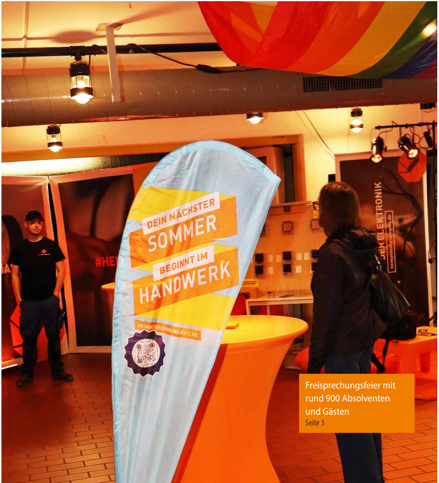
Freisprechungsfeier mit rund 900 Absolventen und Gästen Seite 3

ePaper der Kreishandwerkerschaft Wittekindland