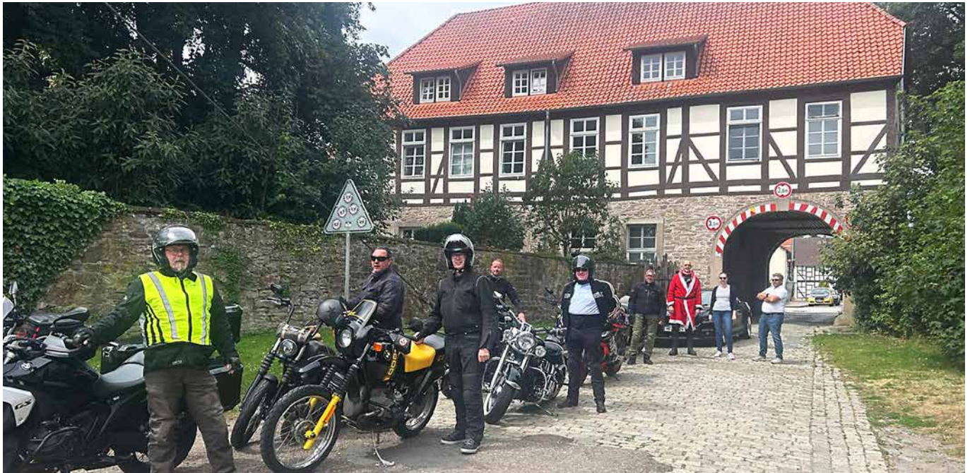
„Bock auf Bike“ – eine Motorradtour durchs Weserbergland unternahmen diese Obermeister heimischer Innungen.