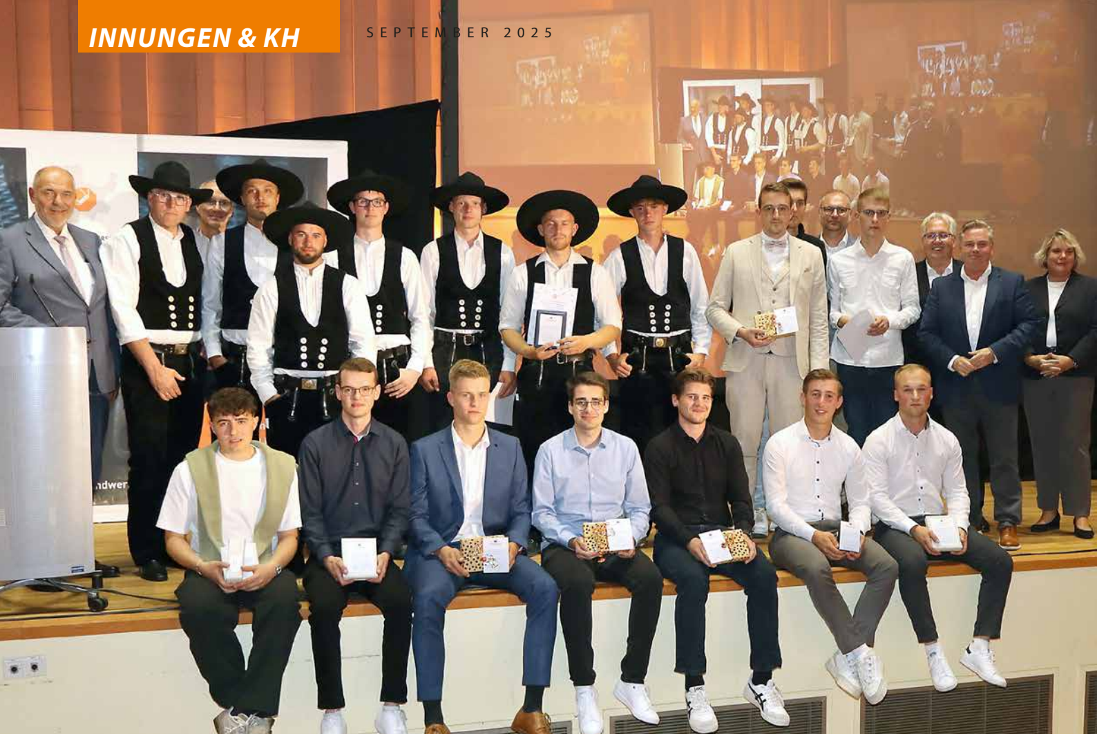
Im Zuge der Freisprechungsfeier wurden schließlich die Prüfungsbesten noch einmal auf die Bühne gebeten und besonders ausgezeichnet mit Multi-Tool-Werkzeugen, Zunftmützen und Simshobeln.