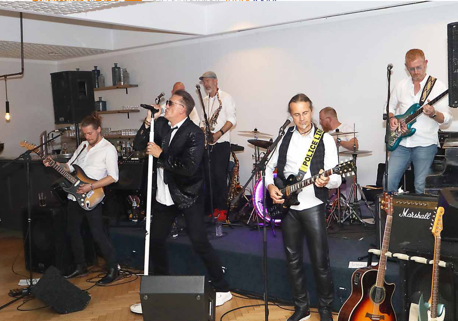
„Mit Pfefferminz bin ich dein Prinz“ und „Willenlos“ sowie vielen weiteren bekannten Hits des Deutsch-Rockers Marius Müller-Westernhagen holte die Band „Sexy“ die Gäste von den Stühlen auf die Tanzfläche.