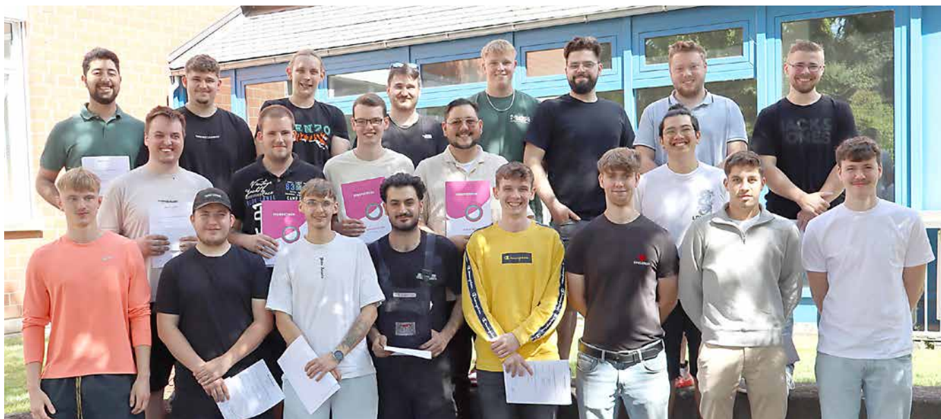
Mehr als im Vorjahr haben nach den „Sommerprüfungen“ im HBZ Minden ihre Bescheinigungen als erfolgreich geprüfte Kfz-Mechatroniker erhalten.