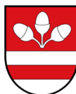
Vlotho – Stadt –

In unserem Wahlprogramm 2025 - 2030 greifen wir genau die Forderung auf. Zitat: „Die Wirtschaft braucht Vertrauen in das politische Handeln „die Sicht nach vorne“, um zu investieren. Wir sind auf die Gewerbesteuereinnahmen angewiesen und sollten alles daransetzen, die lokale Wirtschaft zu stärken. Solange die Ausgaben optimiert werden können sind Steuererhöhungen nicht notwendig. Wir lehnen daher weitere Steuererhöhungen (Grundsteuer A und B) in den kommenden Jahren ab. Im Gegenteil: Wir möchten die Gewerbesteuern von 460% wieder auf 447%-Punkte senken. BBM hat die Haushaltssatzungen der letzten Jahre und auch die für 2025 mit Planungen bis 2028 abgelehnt. Wir lehnen weitere Stellenmehrungen im Stadthaushalt ab“ (Quelle: https://www.bbm-minden.de ).