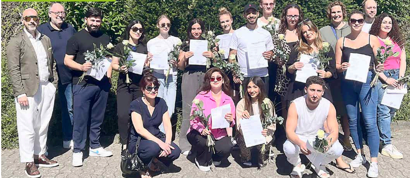
Mitglieder des Vorstandes sowie des Prüfungsausschusses freuen sich mit den neuen Gesellinnen und Gesellen über deren gelungenen Abschluss ihrer Ausbildungsjahre.