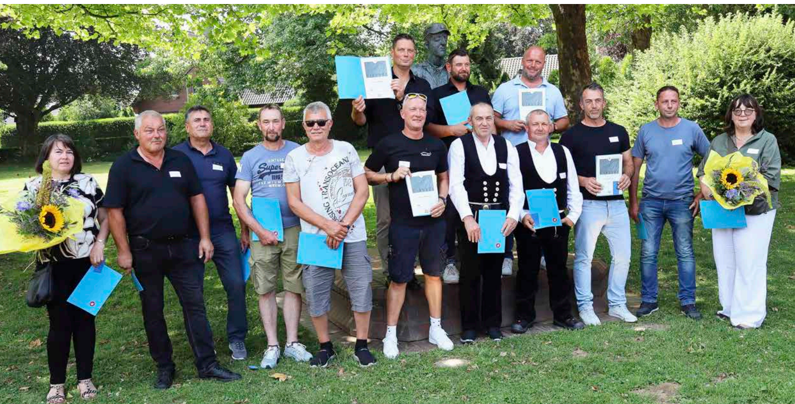
Diese Jubilare wurden mit den Silbernen Ehrennadeln des Dachdecker-Handwerks ausgezeichnet.