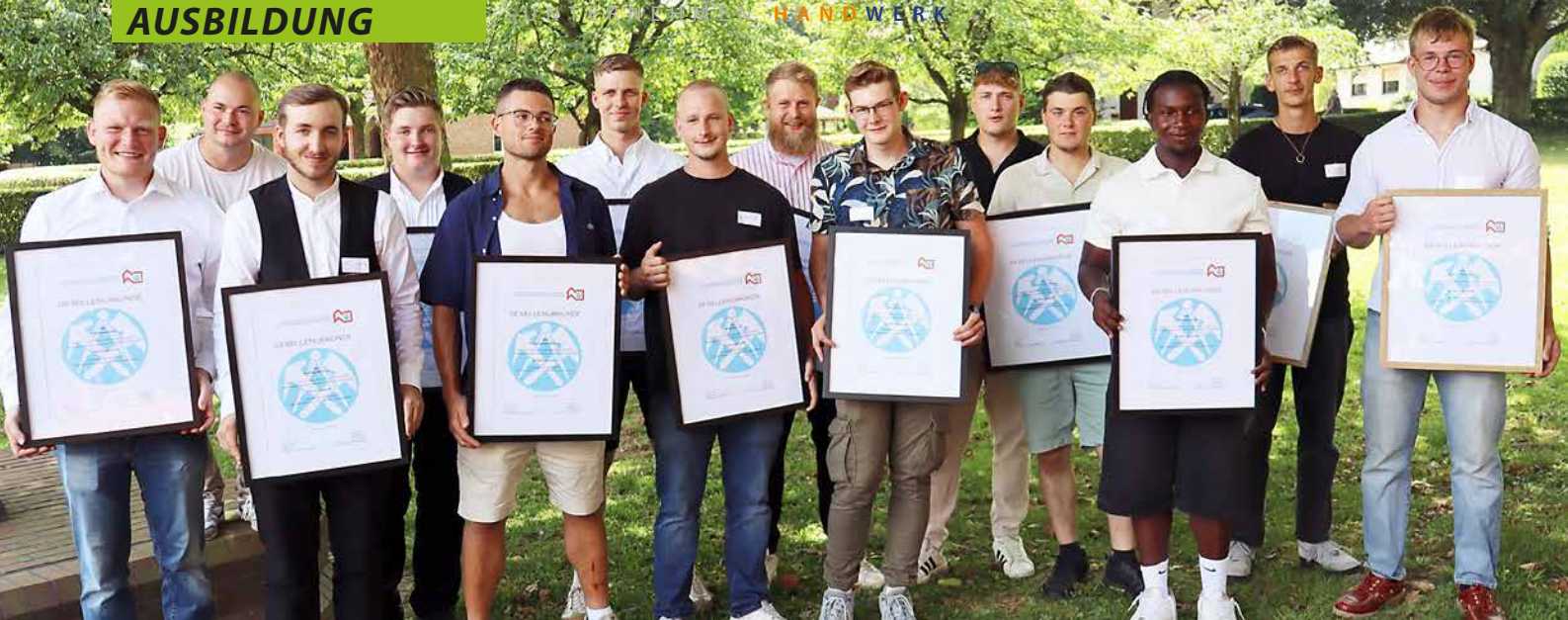
Auf dem Sommerfest der Dachdecker-Innung Wittekindsland nahmen diese neuen Fachkräfte des Dachdeckerhandwerks in den Kreisen Herford und Minden-Lübbecke ihre Gesellenurkunden persönlich entgegen.