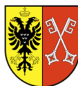
Minden – Kreisstadt –