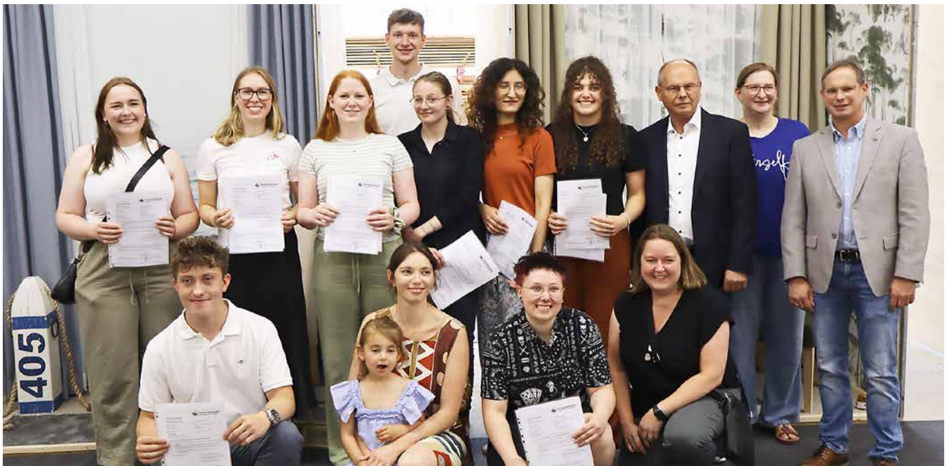
Die neuen Gesellinnen und Gesellen in Ostwestfalen-Lippe, die ihre Prüfungen als Raumausstatter oder Raumausstatterinnen bestanden haben, und Mitglieder des Gesellen-Prüfungsausschusses.