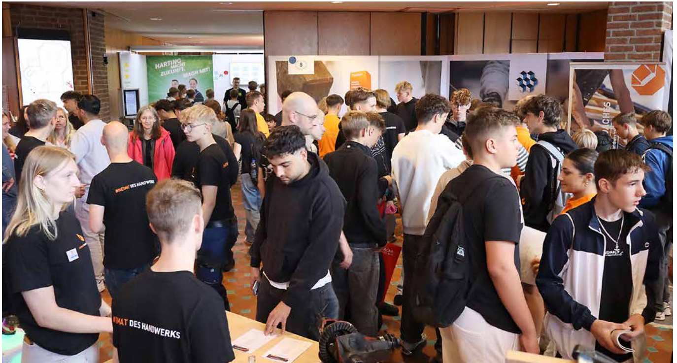
An der #HeimatDesHandwerks führte kein Weg vorbei – sie war aber auch kein „Durchgangsposten“, sondern für die künftigen Schulabgänger immer wieder auch eine Station, an der sie Interesse für die vielfältigen Handwerksberufe zeigte.

nung für Zimmerei und Holzbau Minden-Lübbecke, die Baugewerke-Innung Minden-Lübbecke, die Elektro-Innung Minden-Lübbecke, die Innung des Metallhandwerks Minden-Lübbecke sowie Innung für Sanitär-, Heizungs- u. Klimatechnik Minden-Lübbecke und Maler- und Lackierer-Innung Minden-Lübbecke.