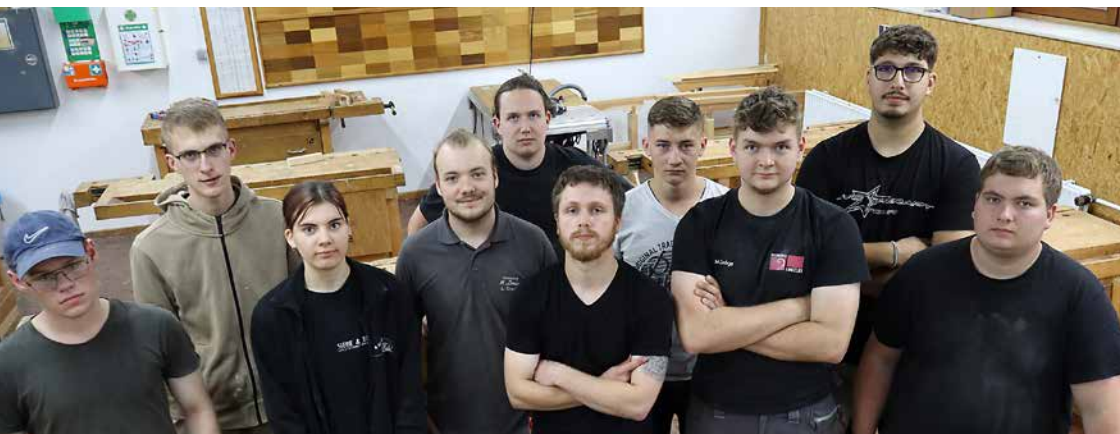
Die neuen Fachkräfte des Tischler-Handwerks, die im HBZ Lübbecke ihre Gesellenprüfungen bestanden haben. Das Foto entstand vor der Bekanntgabe der Ergebnisse – entsprechend angespannt wirken die Absolventen...