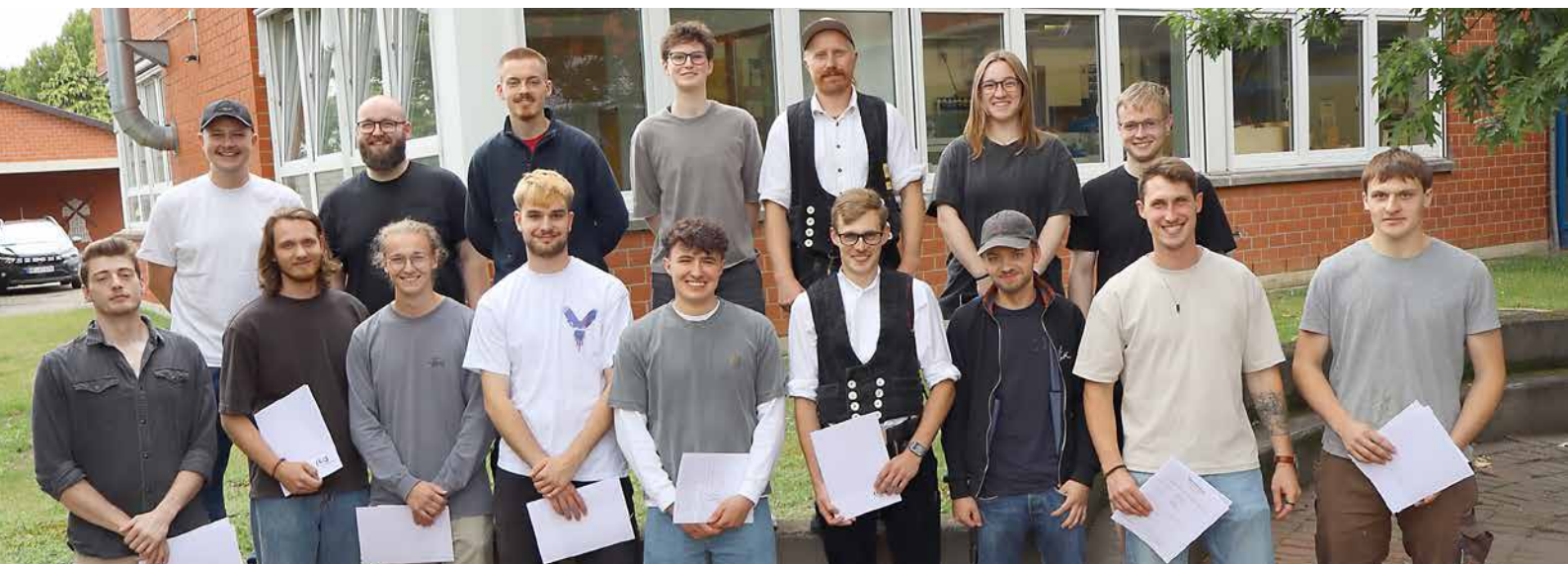
Diese neuen Tischlergesellinnen und -gesellen haben im HBZ Minden ihre Abschlussprüfungen erfolgreich bestanden.