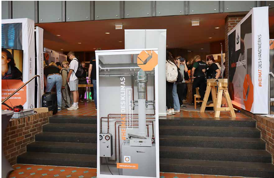
Wenn in Espelkamp die BAM stattfindet, hat das Handwerk einen besonderen Platz. Wenn die Besucherinnen und Besucher zu den Infoständen anderer Ausbildungsanbieter im Bürgerhaus möchten, führt der Weg unweigerlich durch die #HeimatDesHandwerks.

Von einem solchen kann zweifellos gesprochen werden, wenn das Handy während der Arbeitszeit zu privaten Zwecken benutzt wird wie beispielsweise für Chats mit Freunden und Online-Games. Selbst wenn es im Ausbildungsbetrieb keine Regeln zur Handynutzung gibt, kann es negative Konsequenzen haben. Denn wenn durch Unaufmerksamkeit oder Ablenkung durch den Handygebrauch Unfälle passieren, hat das unschöne Folgen. Daher sollten Azubi gleich zu Beginn fragen, in welchen Situationen immer die Finger vom Handy zu lassen sind.