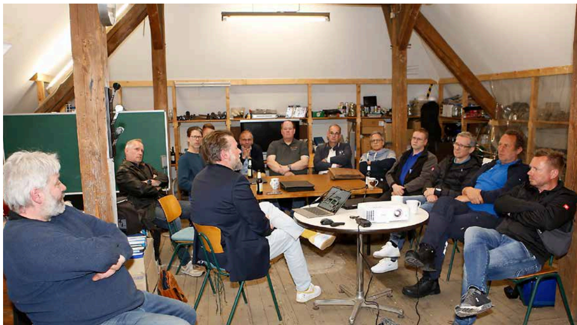
Das jüngste Treffen der Schutzgemeinschaft Wittekindsland fand in der Schlosserei Reichardt in Minden statt.